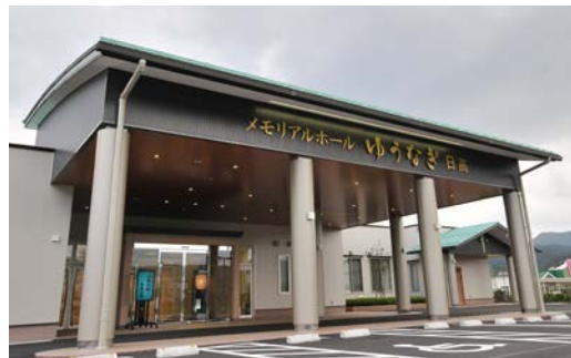
メモリアルホール ゆうなぎ日高