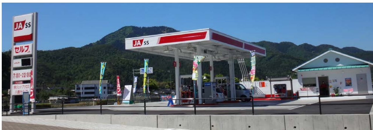
八鹿セルフ給油所（平成 29 年 4 月 25 日オープン）

ジェイ・アクロスでは、組合員・地域住民がよりメリットを感じていただけるようなサービスの提供に取り組んでいます。また、気持ちよくご利用いただくため、スタッフの接客力向上に向けた研修の充実にも継続的に取り組んでいます。