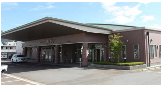
メモリアルホール ゆうなぎ

JA葬祭では、利用者から信頼いただける葬儀社となるため、葬儀プランの提案力や施行技術、接客能力などスタッフの能力向上に向けた研修の充実に取り組んでいます。